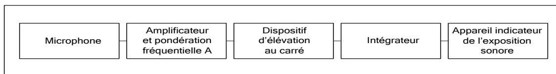
Diagramme fonctionnel d'un exposimètre de bruit adapté de la norme CEI-61252, Édition 1.1 (2002-03)

Les sonomètres intégrateurs autrefois disponibles dans le RSPSAT tels les BK 2218 et 2225 affichaient un L_{eq,t} vrai parallèlement à l'affichage analogique du niveau efficace de bruit pondéré A instantané. Aujourd'hui, les processeurs numériques procèdent à un taux d'échantillonnage très élevé des